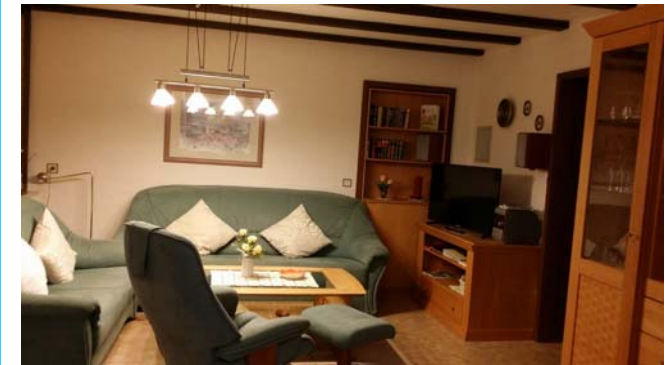
Sesselgruppe mit Fernseher

Fernseher (Kabel), Bettwäsche, Handtücher, Geschirr, Kaffeemaschine, Microwellenherd, Backofen, Elektroherd, Kühlschrank, Brot-schneidemaschine u.v.m.