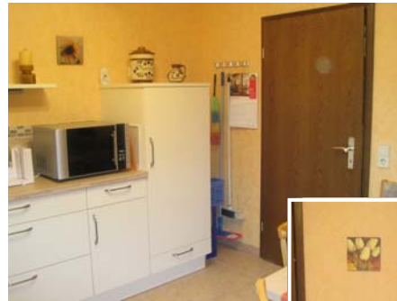
Küchenzeile u. Sitzgruppe mit Eckbank.